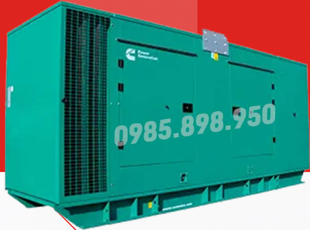
Máy có vỏ chống ồn

Công ty TNHH TBCN MAKAWA hân hạnh gửi đến Quý cơ quan các đặc tính kỹ thuật máy phát điện của hãng model C350D5 như sau: