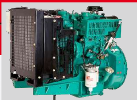
CUMMINS MODEL: X2.5G2