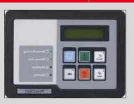
POWERSTART 0500 MODEL: PS0500