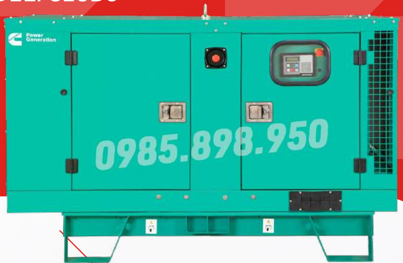
Máy có vỏ chống ồn

Công ty TNHH TBCN MAKAWA hân hạnh gửi đến Quý cơ quan các đặc tính kỹ thuật máy phát điện của hãng model C28D5 như sau: