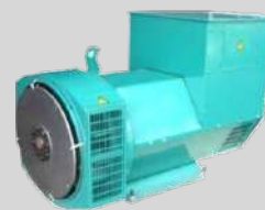
STAMFORD MODEL: PI144E